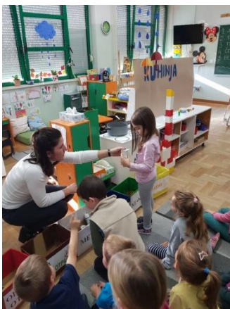
Slika 57 - edukacija u skupini Loptice