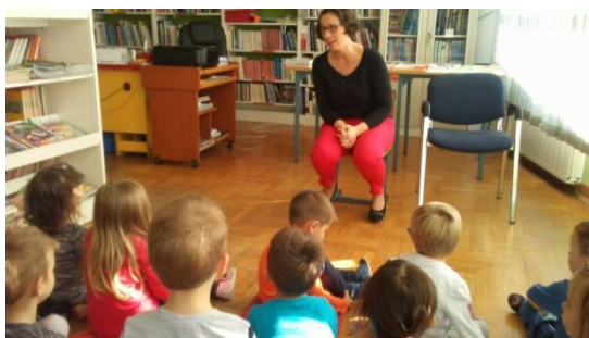
Slika 32 - suradnja s Knjižnicom OŠ

➤ Suradnja s Osnovnom školom obuhvaćala je posjetu Osnovnoj školi, davanje podataka o djeci za upis u prvi razred (mišljenja stručnog tima – logoped, psiholog i pedagog). S obzirom da 5 skupina djece boravi u prostorima OŠ, uključujemo djecu u neke od aktivnosti škole.