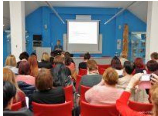
Slika 26 - stručno usavršavanje