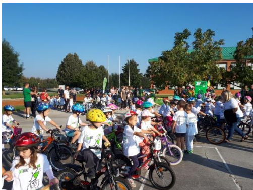
Slika 59 - uključivanje u projekt "BikeForEurope"