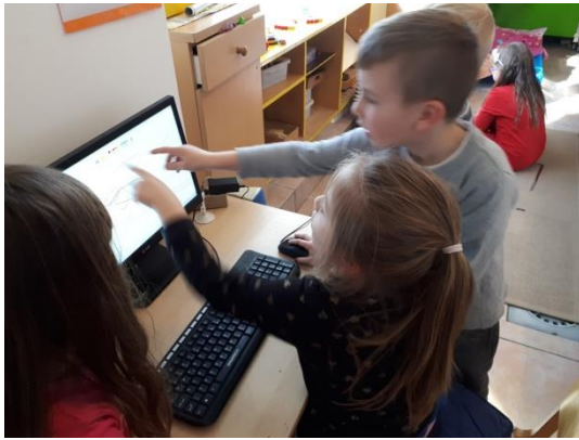
Slika 4 - digitalne kompetencije