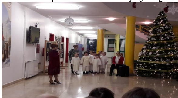
Slika 12 - splet tradicionalnih dječjih igara