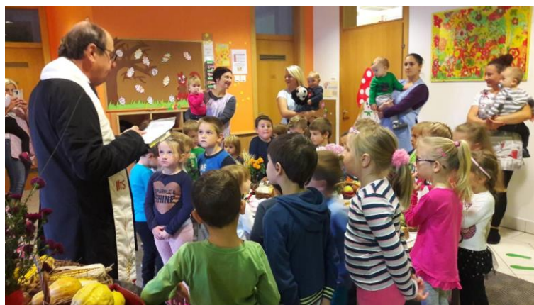
Slika 47 - blagoslov kruha u PO Draškovec