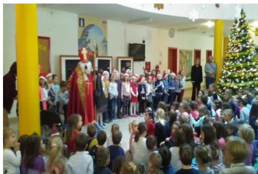
Slika 35 - Sv. Nikola u školi