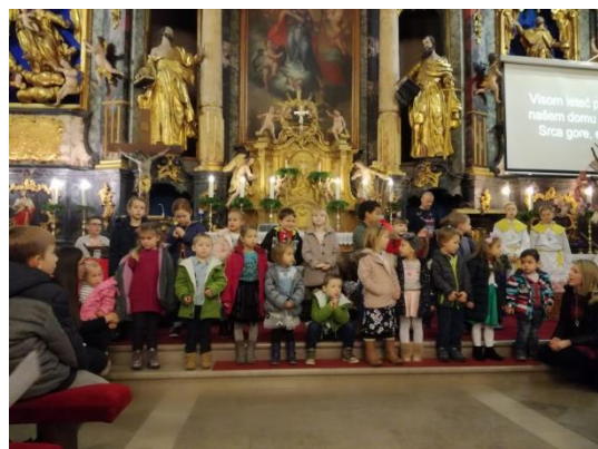
Slika 46 - blagdan Sv. Nikole u župnoj crkvi u Prelogu