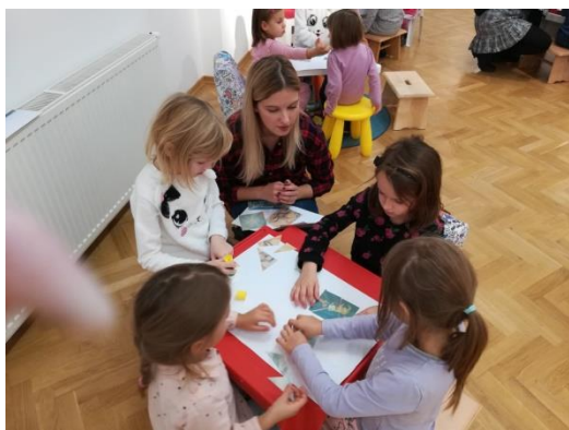
Slika 54 - radionice u Muzeju