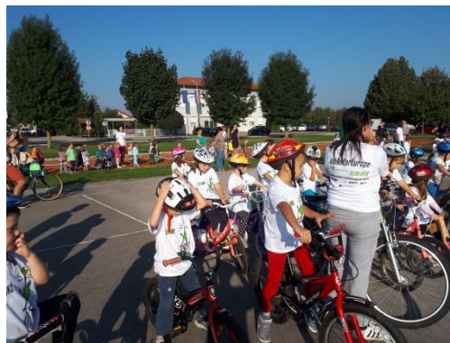
Slika 60 - biciklijada za najmlađe