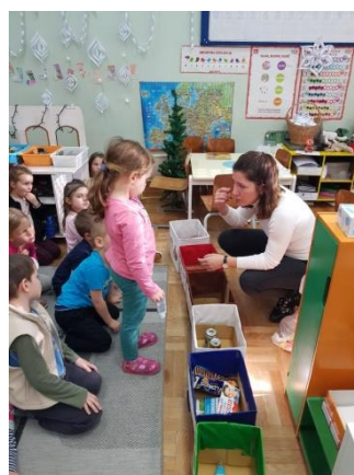
Slika 58 - edukacija u skupini Gljivice