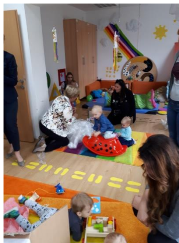
Slika 53- donacija Inner wheel klub Prelog