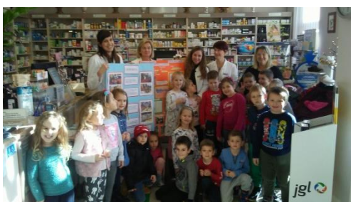
Slika 50 - suradnja s Ljekarnom Prelog

➤ Suradnja sa Ustanovama i Udrugama – redovno surađujemo sa gotovo svim Ustanovama (Muzej Croata insulanus, Srednja škola, Dom kulture) i Udrugama (Društvo Naša djeca, Rotaract Međimurje, Rotary klub Prelog, Inner wheel klub Prelog, sportske udruge...). Samo izravna, kvalitetna i ohrabrujuća komunikacija s roditeljima i lokalnom zajednicom osigurava optimalne uvjete za cjeloviti razvoj djeteta.