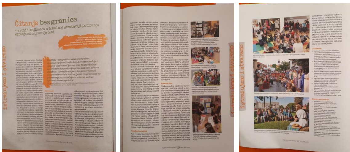
Slike 44- stručni članak u časopisu "Dijete, vrtić i obitelj"