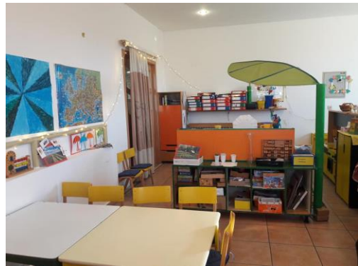
Slika 18 - soba skupine Pčelice