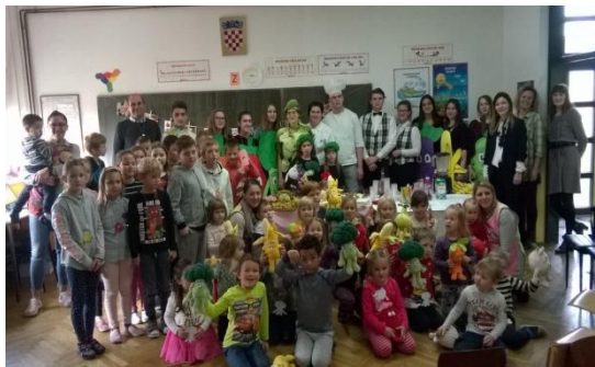
Slika 52 - suradnja sa SŠ Prelog