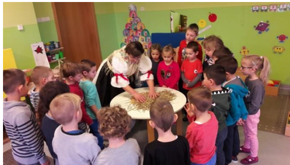
Slika 11 - čuvanje tradicije - posjeta bake

h) kulturna svijest i izražavanje – razvijaju se poticanjem stvaralačkog izražavanja ideja, iskustva i emocija djeteta u nizu umjetničkih područja koja uključuju glazbu, ples, kazališnu, književnu i vizualnu umjetnost, pri čemu dijete razvija svijest o važnosti estetskih čimbenika u vrtićkim aktivnostima i svakidašnjem životu; osnažuju se i razvojem svijesti djeteta o lokalnoj, nacionalnoj i europskoj kulturnoj baštini i njihovu mjestu u svijetu, kao i osposobljavanjem djeteta za razumijevanje kulturne i jezične raznolikosti Europe i svijeta. Kompetencije se razvijaju i jačaju aktivnim i sudjelujućim metodama rada koje djetetu omogućuju slobodu i autonomiju djelovanja i stjecanja znanja, vještina i sposobnosti.