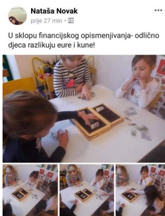
Slika 40- aktivnosti u vrtiću