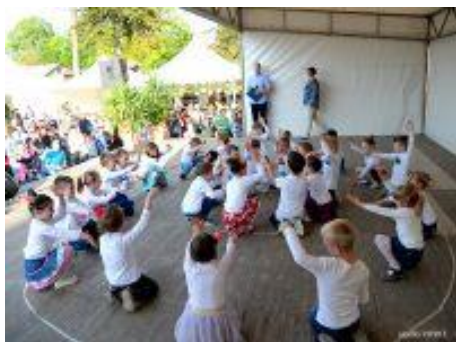
Slika 48 - Sajam cvijeća