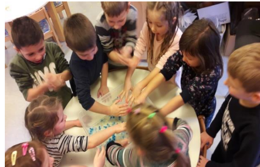
Slika 7 - eksperiment - voda i kuglice