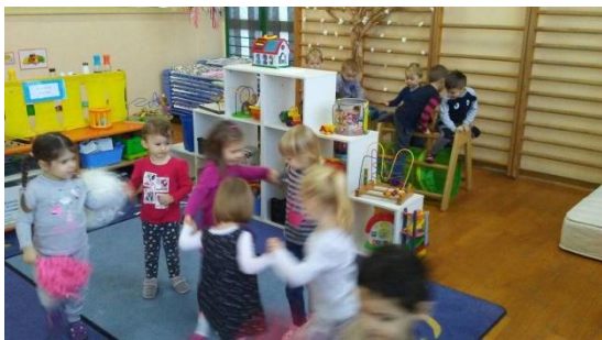
Slika 19 - soba skupine Leptirići i Vjeverice mala dvorana