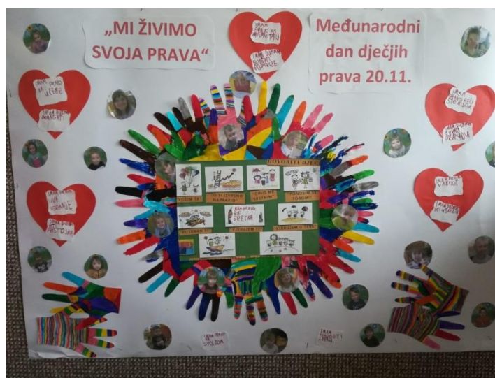
Slika 1 - Dječja prava