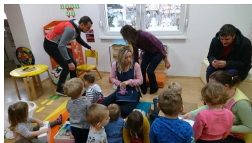
Slika 51 – donacija "Rotaract" Međimurje