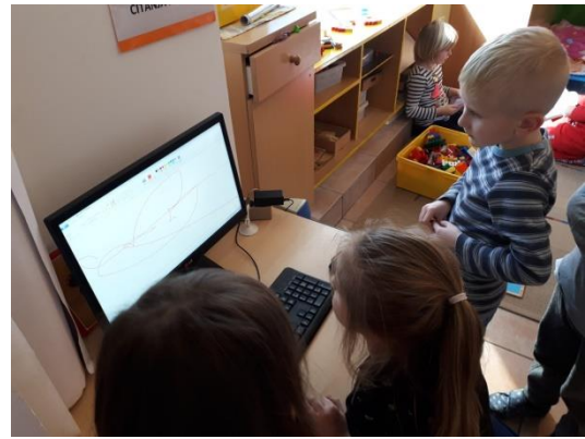
Slika 5 - digitalne kompetencije(2)