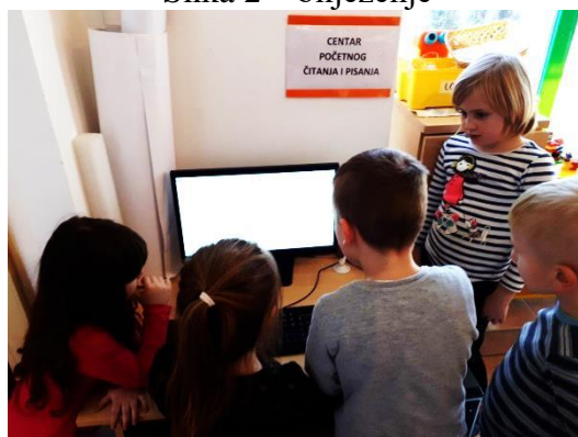
Slika 2 – bilježenje

a) komunikacija na materinskom jeziku – osnažuje se osposobljavanjem djeteta za pravilno usmeno izražavanje i bilježenje vlastitih misli, osjećaja, doživljaja i iskustava u različitim, za njega svrhovitim i smislenim aktivnostima.