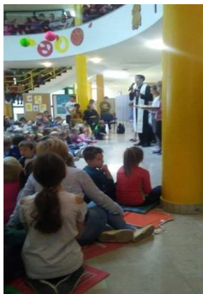
Slika 45 - Dani kruha u OŠ Prelog