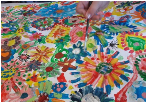
Slika 6 - slikanje temperom

e) učiti kako učiti – odnosi se na osposobljavanje djeteta za osvještavanje procesa vlastitog učenja te uključivanje djeteta u planiranje i organiziranje tog procesa, kao i na poticanje djeteta na stvaranje strategije vlastitog učenja. Osiguravanje obrazovne dobrobiti kod djeteta uključuje pokretanje stvaralačkog potencijala kod djeteta, identifikaciju novih izvora učenja te osvještavanje djetetovog vlastitog procesa učenja i preuzimanja odgovornosti za taj proces.