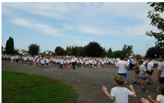
Slika 34 - obilježavanje Dana sporta