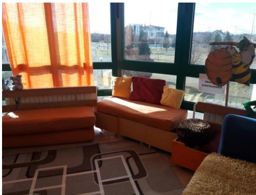
Slika 17 - soba skupine Pčelice

Dvije skupine djece u dobi od 5 i 6 godina borave u učionicama u prizemlju škole. Dvije skupine djece (djeca u četvrtoj i petoj godini života) borave u prostoru male sportske dvorane, na katu (120 m 2 ). Jedna skupina djece u dobi od 5 i 6 godina borave u prostoru za sastanke, na katu Sportske dvorane i taj prostor je trebalo preurediti, kako bi se odgojno-obrazovni rad mogao nesmetano odvijati. Na stepeništa su postavljene zaštitne ograda i vrata, tako da su stvoreni sigurnosno-zaštitni uvjeti za boravak djece u tim prostorima.