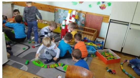
Slika 20 - soba skupine Loptice – razred OŠ