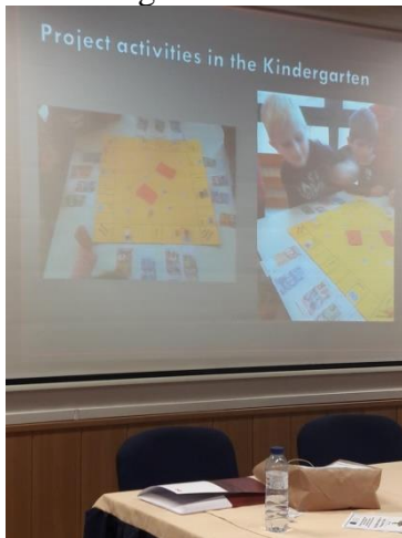
Slika 42 - prezentacija projekta "OTTT" u Portugalu