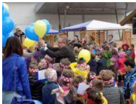
Slika 49 - Dan Europe