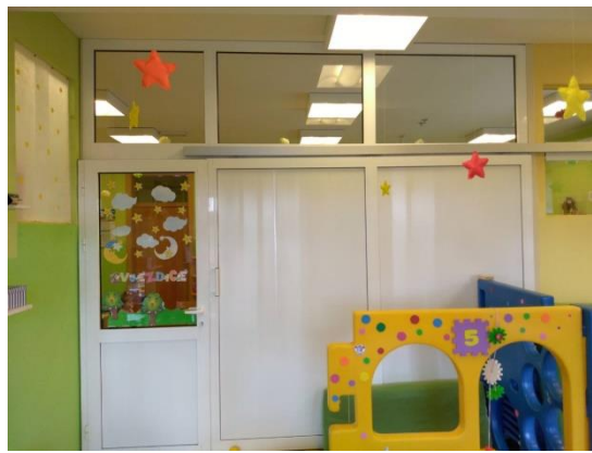
Slika 24 - pregradna, klizna stijena