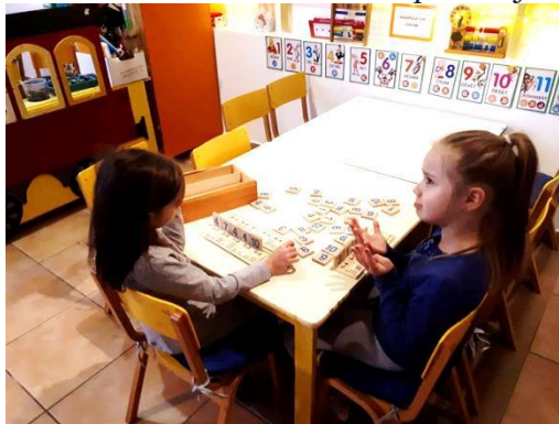
Slika 3 - matematičke kompetencije

c) matematička kompetencija i osnovne kompetencije u prirodoslovlju – matematička kompetencija razvijala se poticanjem djeteta na razvijanje i primjenu matematičkoga mišljenja u rješavanju problema, u različitim aktivnostima i svakidašnjim situacijama; prirodoslovna kompetencija razvijala se poticanjem djeteta na postavljanje pitanja, istraživanje, otkrivanje i zaključivanje o zakonitostima u svijetu prirode te primjenu prirodoslovnoga znanja u svakidašnjem životu; ove kompetencije uključuju i razumijevanje promjena uzrokovanih ljudskom djelatnošću te odgovornosti pojedinca za njih, kao i očuvanje prirode i njezinih resursa.