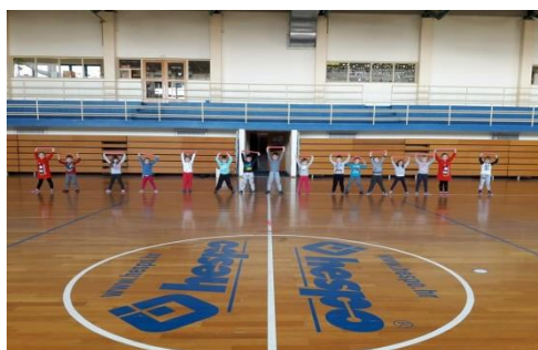
Slika 33 - vježbanje u školskoj dvorani