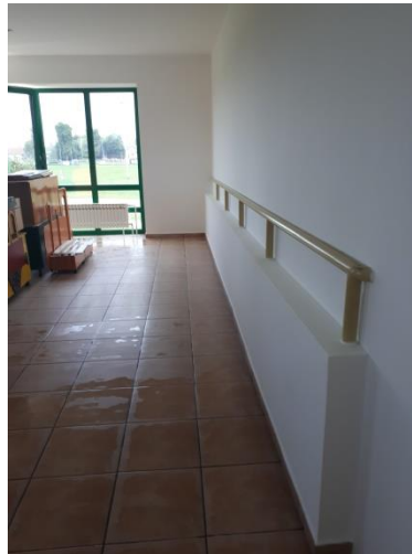
Slika 21 - pregrade - knauf ploče