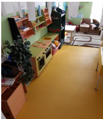
Slika 22- novi pod u PO Cirkovljanu