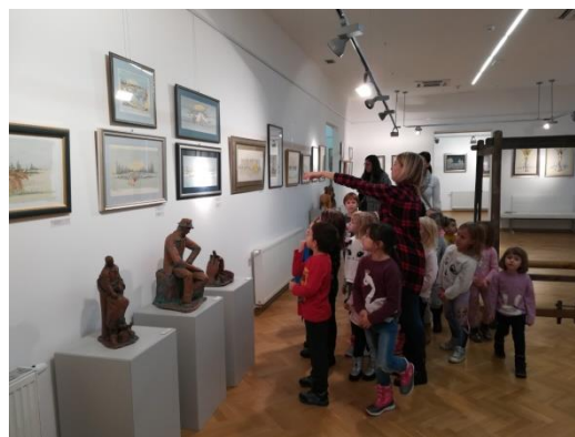
Slika 55 – razgledavanje Izložbe