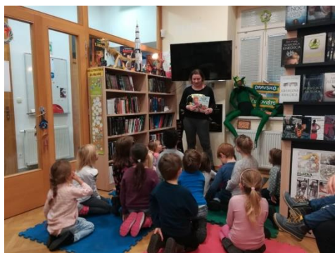
Slika 36 - pričanje priča u Knjižnici