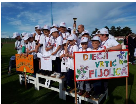
Slika 56 - Olimpijski festival dječjih vrtića

➤ Suradnja sa Zajednicom sportskih udruga Međimurske županije – na Olimpijskom festivalu dječjih vrtića Međimurske županije redovito zauzimamo vodeća mjesta.