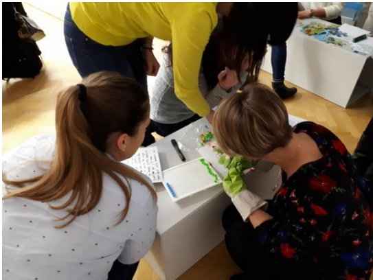
Slika 25 - stručno usavršavanja