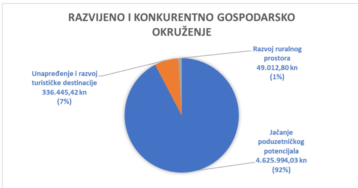
Grafički prilog 1. Raspodjela sredstava po prioritetima unutar strateškog cilja 1. Razvijeno i konkurentno gospodarsko okruženje

Za 2. strateški cilj SRGP-a naziva Unaprijeđena kvaliteta življenja u 2020. godini planirana je potrošnja od 23.475.070,00 kn dok je realizirano 97,24 % odnosno 22.826.700,87 kn.