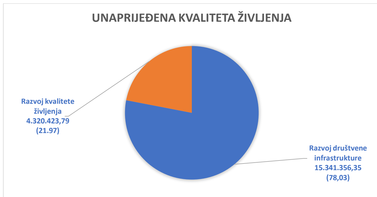
Grafički prilog 1. Raspodjela sredstava po prioritetima unutar strateškog cilja 2. Unaprijeđena kvaliteta življenja Izvor: Izvršenje plana razvojnih programa za 2022. godinu

Za mjeru 2P2M5 Unapređenje programa prevencija te ranog otkrivanja i liječenja bolesti koje su prepoznate kao vodeći uzroci smrtnosti planirano je 57.000,00 kn, a utrošeno je 51.775,00 kn, što je 90,83 % od planiranog iznosa. Većina aktivnosti koje su provedene u ovoj mjeri vezane su za donacije Crvenom križu, za usluge laboratorijskih pretraga (vađenje krvi u ambulanti Prelog) te zasekundarnu prevenciju iz područja onkologije.