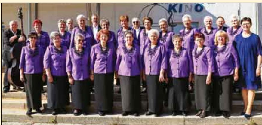
Koncert „Hvala mama“

Na početku godine zbor je organizirao tradicionalno zajedničko druženje u Gradskoj kavani Lovac u Prelogu. U svibnju su povodom Majčinog dana uspješno realizirali koncert „Hvala mama“, na kojem su gosti bili zborovi iz Strahoninca, Čakovca i Svete Marije. Tijekom godine zbor je imao brojne nastupe na području Grada Preloga: Sajam cvijeća, Godišnja skupština, trodnevni povodom svetkovine sv. Jakoba u Prelogu, Tjednu župnog caritasa te na misi zahvalnici za 80 godišnje žu-