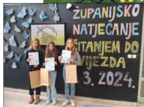
ŽUPANIJSKO NATJECANJE ČITANJEM DO ZVIJEZDA 3. 2024.