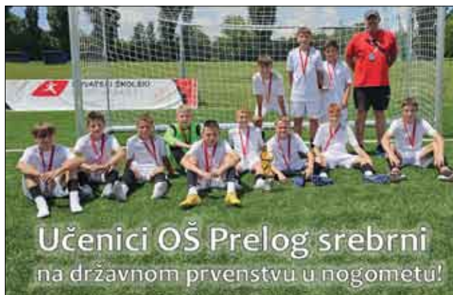
Učenici OŠ Prelog srebrni na državnom prvenstvu u nogometu!