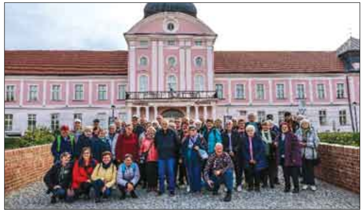
Izlet u Papuk i Viroviticu