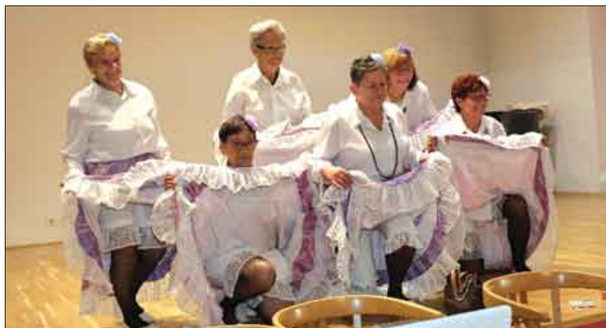
Nastup u Čakovcu zgrada Scheier

Na početku godine sekcija je organizirala Reprizu dočeka Nove godine u kavani Lovac u Prelogu. Plesno-scenska sekcija je ove godine posjetila Dom za starije i nemoćne u Hodošanu gdje je za štitičnike nastupila sa prigodnim programom. U organizaciji Književnog kruga Grada Preloga imali su nastup povodom Međunarodnog dana žena, a nastupali su i za Sajem cvijeća, Godišnjoj skupštini udruge, Križevcima na promociji