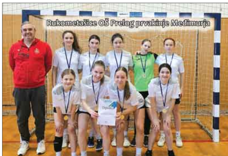
Rukometašice OŠ Prelog prvakinja Medimurja