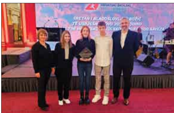
Školsko sportsko društvo Osnovne škole Prelog DRUGO NAJBOLE U HRVATSKOJ!