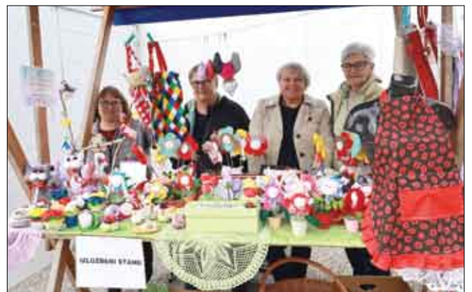
Kreativne radionice na Danima cvijeća u Prelogu