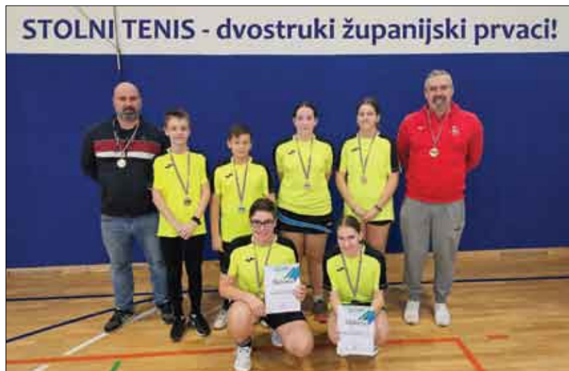
STOLNI TENIS - dvostruki županijski prvaci!