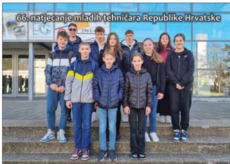
66. natjecanje mladih tehničara Republike Hrvatske