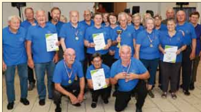
22. Sportske igre Saveza udruga umirovljenika i starijih osoba Međimurske županije, osvojeno 2. mjesto

U sklopu sportske sekcije umirovljenici se tjedno druže u igri kroz belot, viseću kuglanu, šah i pikado. U svibnju je organizirano sportsko natjecanje u Ribičkom domu u Otoku na kojem su se odabrali najbolji sportaši za sportske igre u organizaciji Saveza udruga umirovljenika i starijih osoba Međimurske žu-