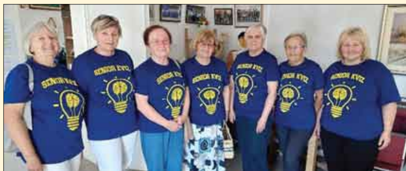
Senior trivia kviz – kvizašice u novim majicama

Povodom Noći knjige knjižnica je organizirala u Multimedijalnoj dvorani kviz u kojem su sudjelovali: Udruga umirovljenika iz Čakovca, Preloga, Nedelišća, Kotoribe i Srednja škola Prelog.